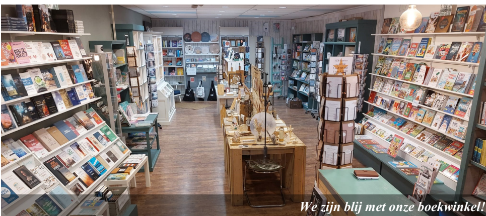
We zijn blij met onze boekwinkel!

Heeft u al zo'n mooie Hoodie? Te bestellen op deontmoetingsboeken.nl/gifts De opbrengst gaat 100% naar De Ontmoeting.