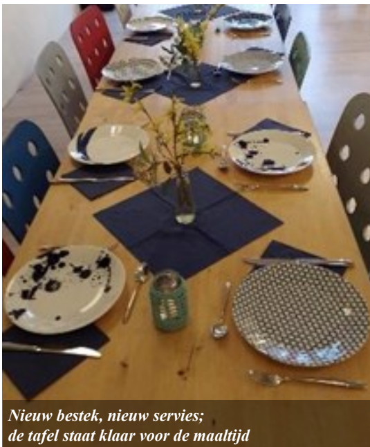
Nieuw bestek, nieuw servies; de tafel staat klaar voor de maaltijd

God legt ons in de watten en geeft ons wat we nodig hebben (zelfs als we liggen te slapen ☺).