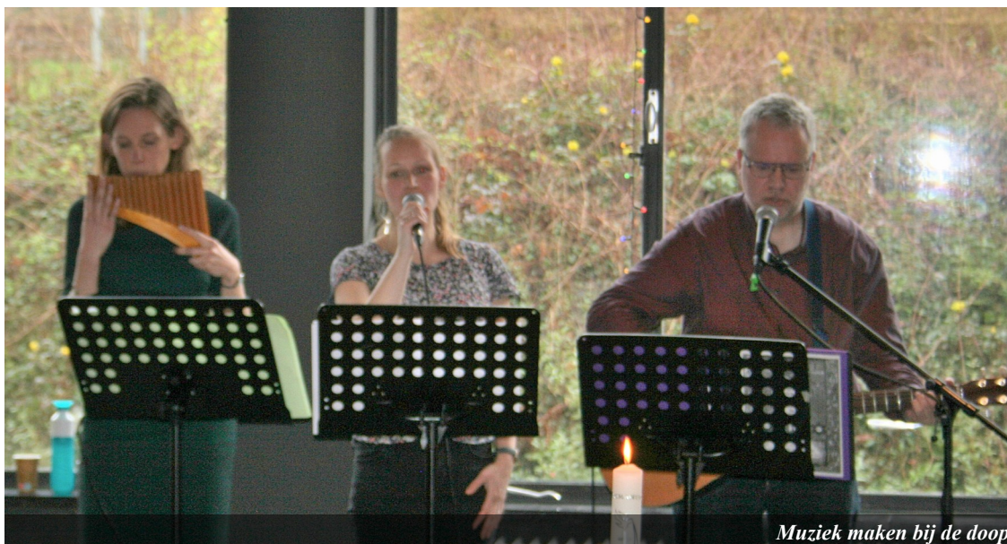
Muziek maken bij de doop

Op 18 maart jl. organiseerde Nederland Zoekt een Visiedag in Nijkerk. Mensen van allerlei organisaties en achtergronden waren uitgenodigd om mee te denken over de vraag: wat heeft de kerk van nu nodig, hoe kan Nederland Zoekt nog meer tot zegen zijn om als kerken het goede nieuws te zijn? In de middag hebben we gekozen voor het perspectief van de verschillende