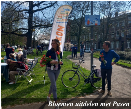
Bloemen uitdelen met Pasen

“Genade en vrede voor elke vreemdeling, die zoekt naar de waarheid en geluk. Hier ben je welkom om te zijn wie je bent. Te zoeken naar wat God jou heeft gegund...”