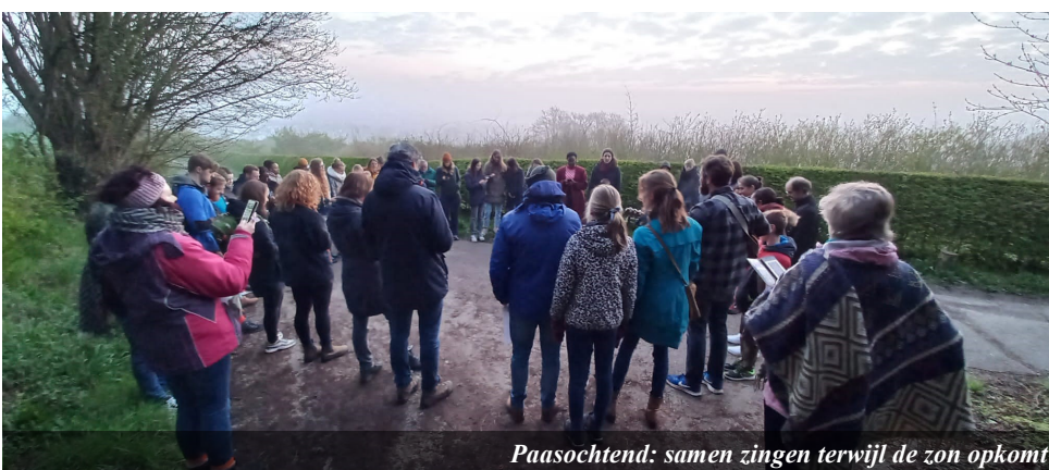
Paasochtend: samen zingen terwijl de zon opkomt