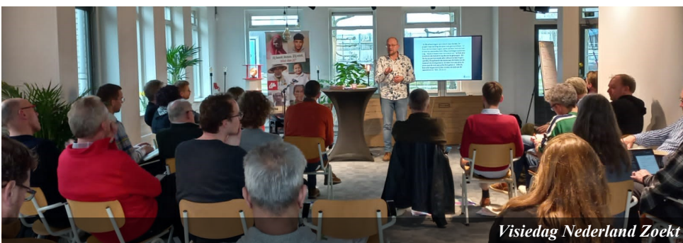
Visiedag Nederland Zoekt